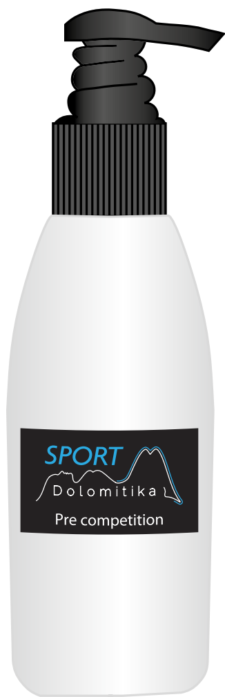
Flacone con dispenser 150 ml

Importante prevenzione della formazione di acido lattico. Riduzione dell'insorgere della fatica. Tempo di riscaldamento accorciato.