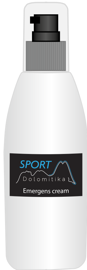
Flasche mit Abgabevorrichtung 150 ml

Starke erleichternde Wirkung in posttraumatischen Situationen. Verringerung der Erholungszeit.