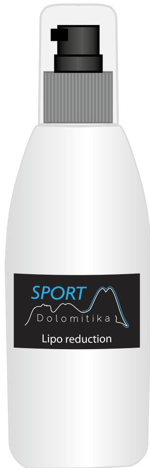
Flasche mit Abgabevorrichtung 150 ml

Wesentliche Verbesserung der Mikrozirkulation der Haut.