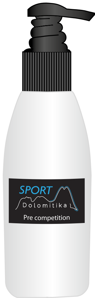
Flasche mit Abgabevorrichtung 150 ml

Wichtige Minderung der Milchsäure Bildung. Verringerung der Ermüdung. Verringerte Aufwärmungszeit.